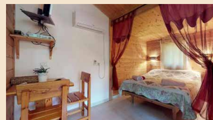
We overnachten in: Guesthouse A place in the Heart Moshav Ein Yahav